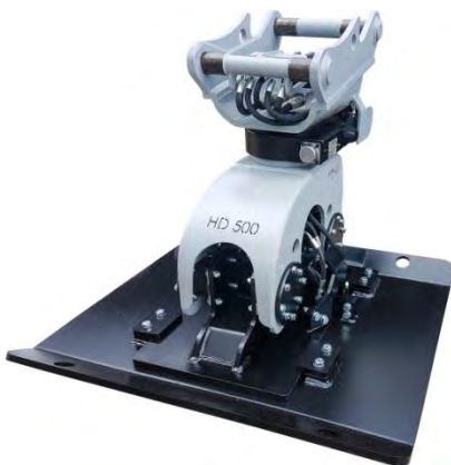
Abb. inkl. optionaler Verbreiterungsplatte

Die UAM proline Anbauverdichter erhalten ein noch umfangreicheres Einsatzgebiet durch die Verwendung von folgendem optionalem Zubehör: