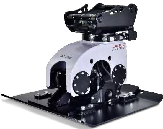
Abb. inkl. optionaler Verbreiterungsplatte

Die UAM proline Anbauverdichter erhalten ein noch umfangreicheres Einsatzgebiet durch die Verwendung von folgendem optionalem Zubehör: